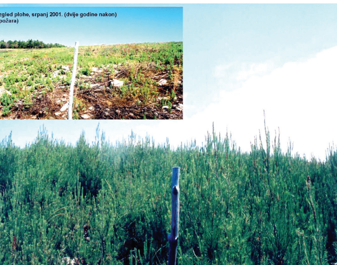
Uzgoj plohe, srpanj 2001. (dvije godine nakon požara)