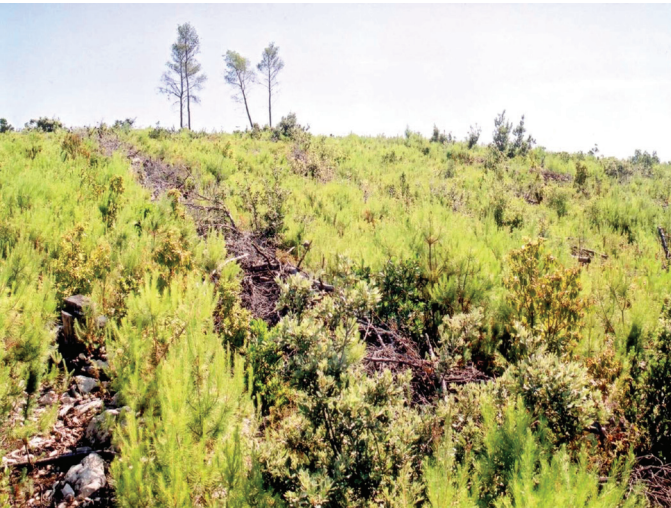
Slika 2. Sanacija opožarene površine metodom pruganja, ploha 2, Šumarija Korčula, srpanj 2002.

Figure 2. Sanation of forest-fire site by gathering of burnt material into strips, experimental plot No. 2, Forest Office Korčula, July 2002