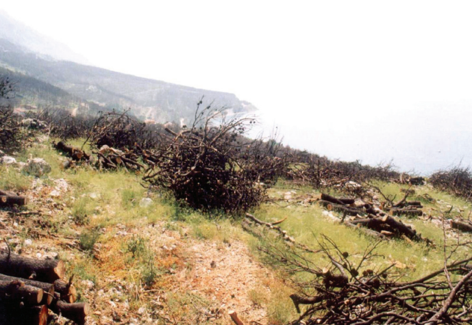
Figure 1. Sanation of forest-fire site by piling of burnt material, experimental plot No. 1, Forest Office Split, July 2001

Slika 1. Sanacija opožarene površine slaganjem na hrpe, ploha 1, Šumarija Split, srpanj 2001.