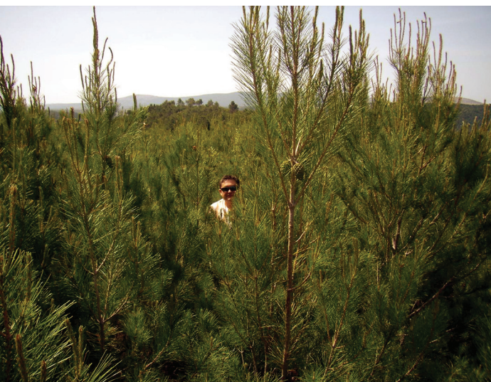
Slika 5. Izgled sastojine, srpanj 2009., visine biljaka alepskog bora preko 4 m