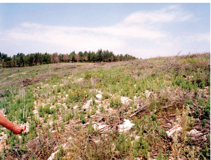
Slika 3. Sanacija opožarene površine na plohi 3, Šumarija Šibenik, - usitnjeni izgoreni materijal posložen po tlu, srpanj 2001.

Figure 2. Sanation of forest-fire site by gathering of burnt material into strips, experimental plot No. 2, Forest Office Korčula, July 2002